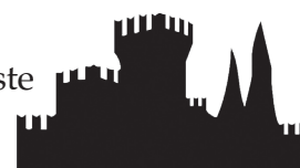
TERME DI SIRMIONE